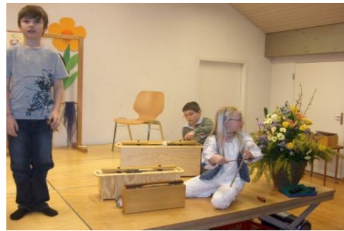
König Tinizong mit dem Zaubergong am Konzert der Musikschulwoche