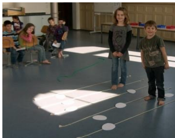
Wo stehen die Noten, im Zwischenraum oder auf der Linie?