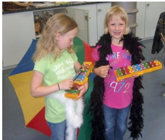
Papageno mit dem Zauberglockenspiel aus Mozarts Zauberflöte